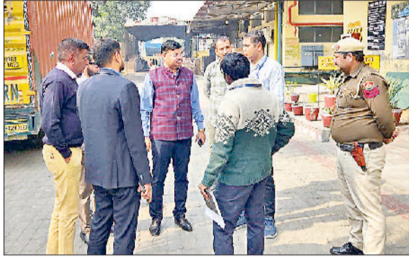
सोनीपत। एक फैक्टरी में निरीक्षण करते अधिकारियों।