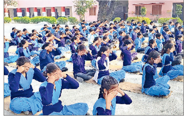
सोनीपत। शिविर के दौरान योग करते विद्यार्थी।