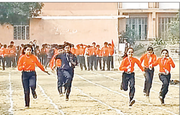
खरखौदा। दौड़ में भाग लेते विद्यार्थी।