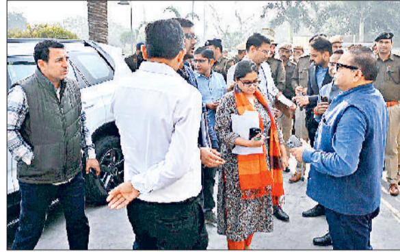
सोनीपत। अधिकारियों की टीमों को निर्देश देते हुए उपायुक्त।