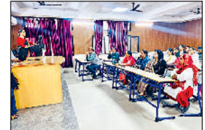
सोनीपत। शिविर के दौरान शिक्षकों को जागरूक करते हुए वक्तवा।