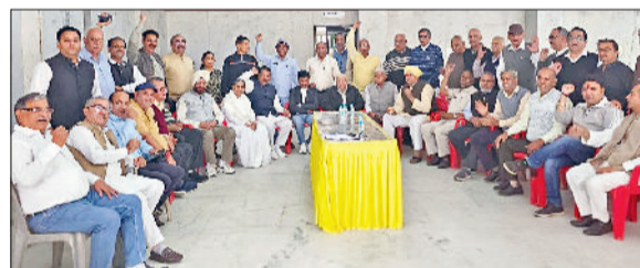
सोनीपत। बैठक के दौरान मौजूद विभिन्न संस्थाओं के पदाधिकारी।

सोनीपत के सुभाष स्टेडियम में 28 नवंबर से 1 दिसंबर तक जिला स्तरीय गीता महोत्सव का आयोजन होगा। महोत्सव की तैयारियों को लेकर शुक्रवार को सामाजिक, धार्मिक व अन्य संगठनों की बैठक हुई। बैठक में सभी संगठनों के द्वारा गीता महोत्सव को भव्यता व शानदार ढंग से मनाने के लिए फैसला लिया गया। बैठक में शोभा