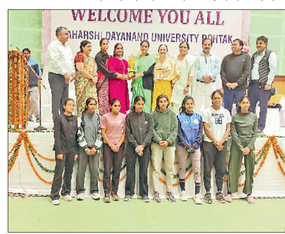
सोनीपत। विजेता खिलाड़ियों को सम्मानित करते हुए।